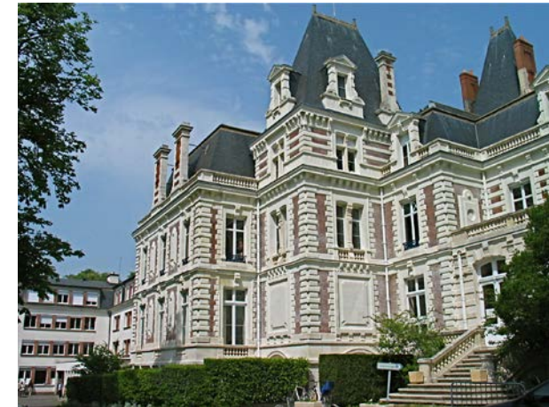
Amphi théâtre du lycée agricole